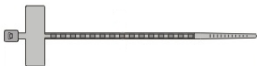
YKB MCV 2,5x100, YKB MCV 2,5x200S, YKB MCV 2,5x200SS